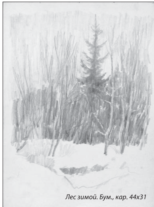
Лес зимой. Бум., кар. 44x31