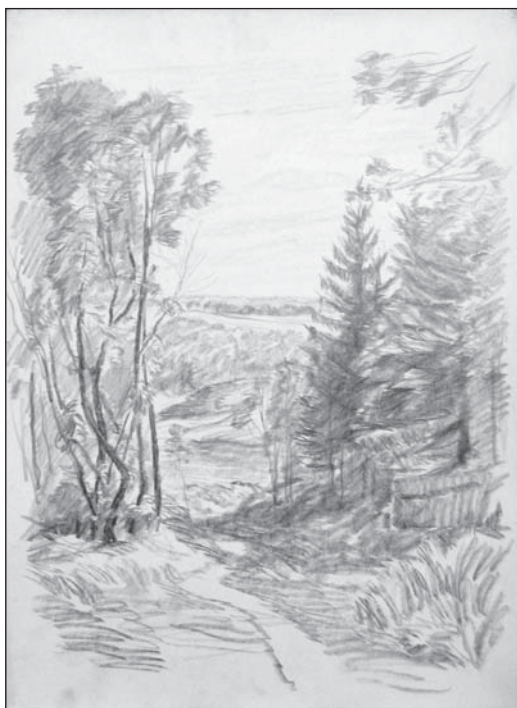
Тропинка в лесу. Бум., кар. 43x30,5