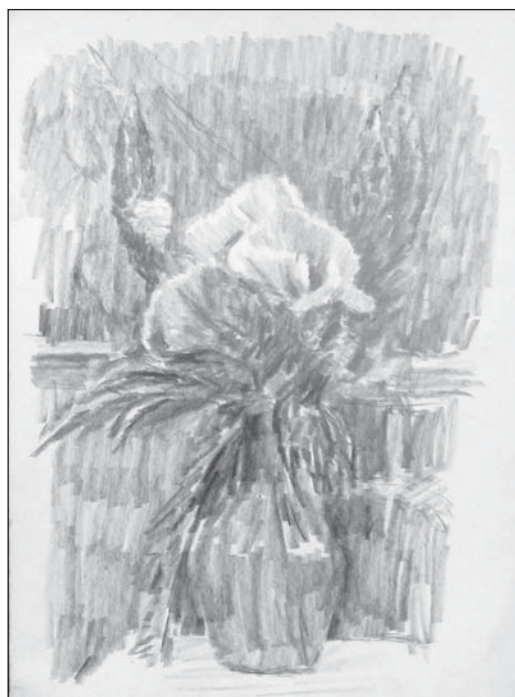
Маки. Бум., кар. 43x31