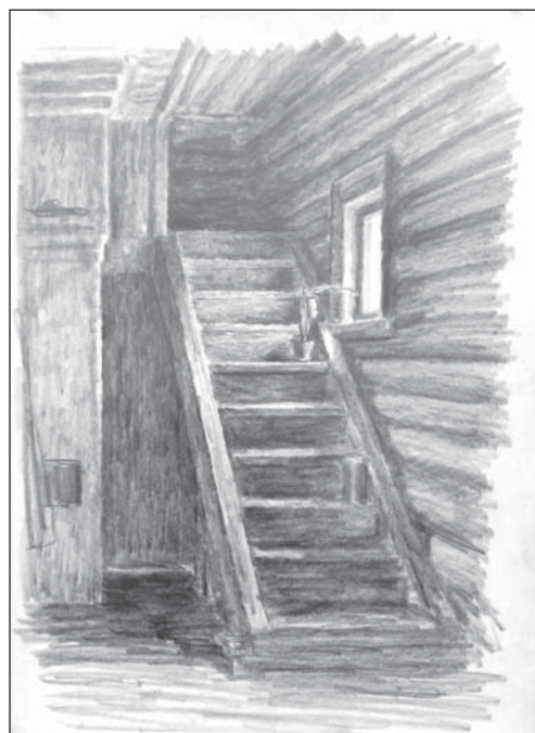
Лестница. Бум., кар. 44x31