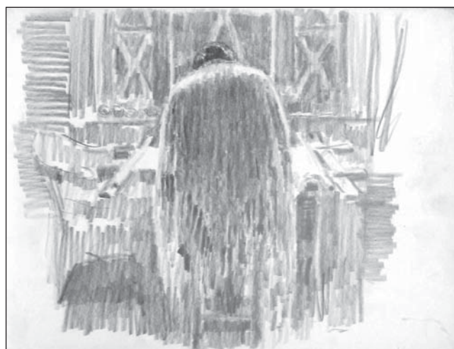
Шаль. Бум., кар. 31x42,5