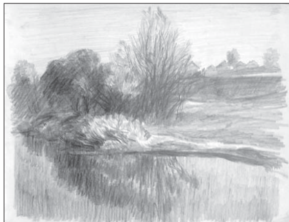
У воды. Бум., кар. 31x41