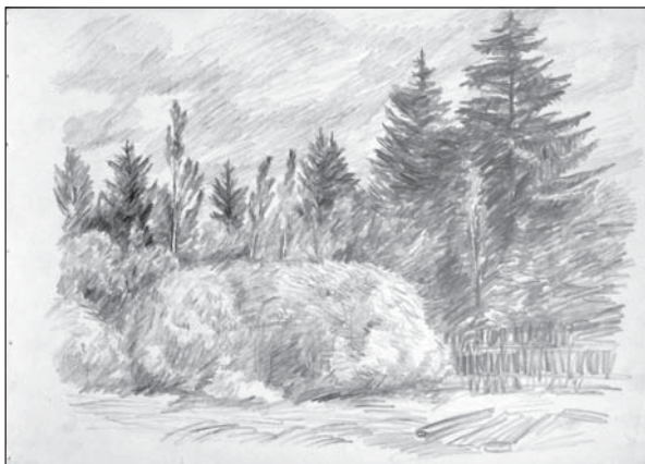
Сток сена. Бум., кар. 30x43