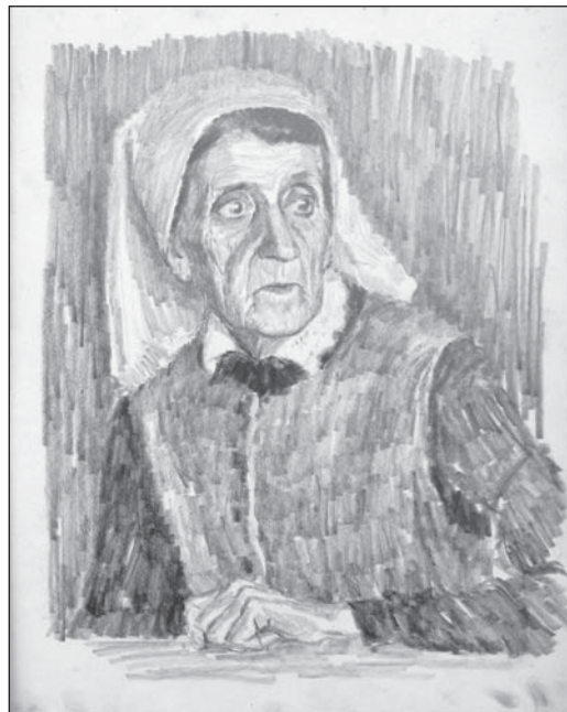
Портрет женщины. Бум., кар. 42x32

Но, несмотря на сильное желание учиться, помощь и поддержку со стороны близких, в 1920-м году Николай тяжело заболел и вынужден был уехать из Москвы в Рязань, прервав обучение в училище. Спокойная и созерцатель-